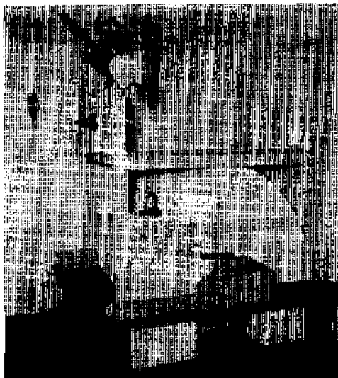
Ofen mit Ofenbank und „Ofengschal“