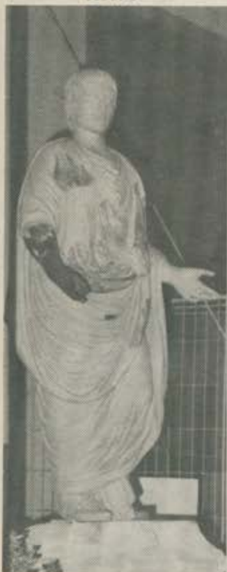
Rekonstruktion einer Togastatue mit den Originalteilen im Grabungsmuseum Aguntum