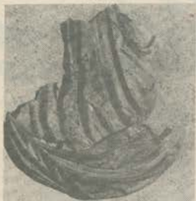
Fragment einer Togastatue aus Aguntum

lange Zeit hindurch von Kelten beherrscht und ich denke, wir können annehmen, daß ein keltisches Element in der geistigen Struktur der Bevölkerung Oberitaliens auch noch längere Zeit nach der Unterwerfung durch die Römer weiterlebte.