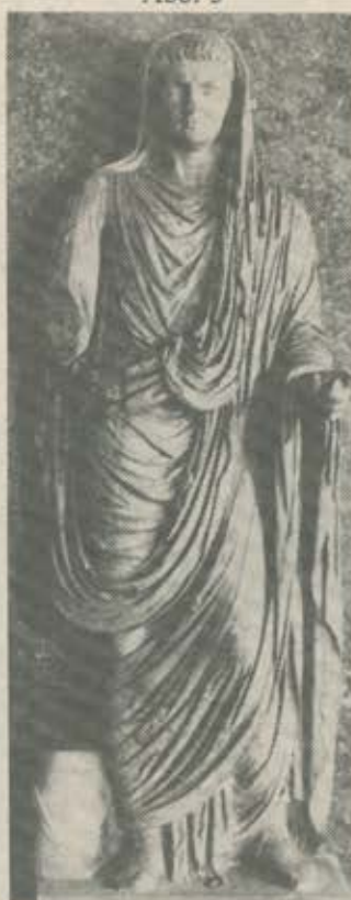
Togastatue mit dem Portrait des Claudius in Parma.