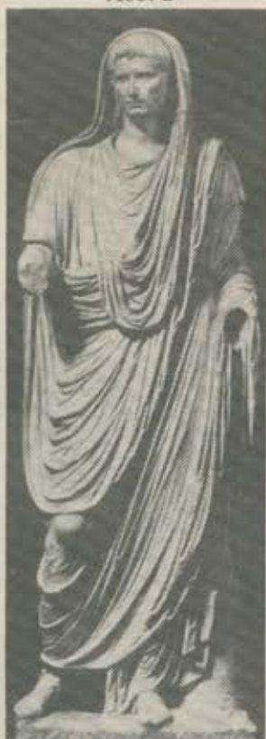
Togastatue des Augustus in Rom. Nach Aufnahme Alinari 30157