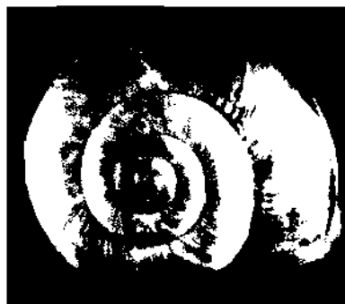
Arianta chamaeleon wiedemayri

wohl aber als Neuheit und Besonderheit erkannt.