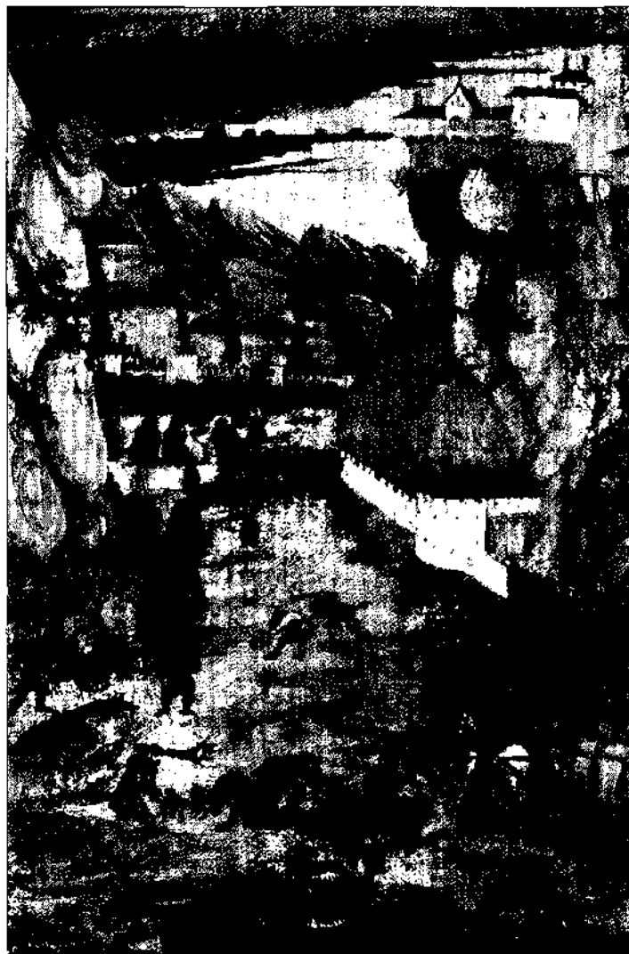
Krebsfang bei der Lienzer Klause. – Miniatur des Hofmalers Jörg Ködlerer im Tiroler Fischereibuch Maximilians I., 1504. Die Darstellung, die nicht beschriftet ist, gibt zwar nicht in naturalistischer Weise die genaue topographische Situation wieder, doch kommt im Zusammenhang mit dem Text keine andere Möglichkeit in Frage.